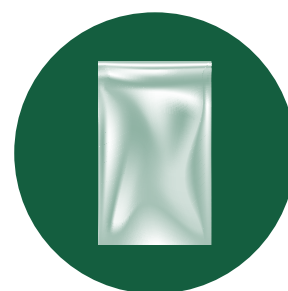
Bolsa de sección