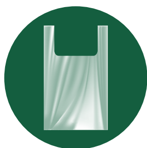
Bolsa tipo camiseta