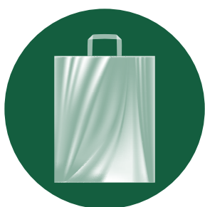
Bolsa de asa lazo